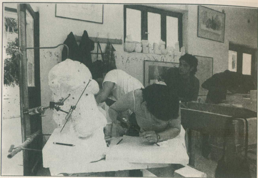
Εικ. 5: Πρακτική άσκηση στο μάρμαρο.